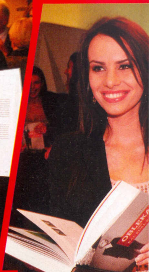
Miss Universe 2009 Mirela Korač se dobro zaveda, da mora biti ženska v vsakem trenutku brezhibno urejena.