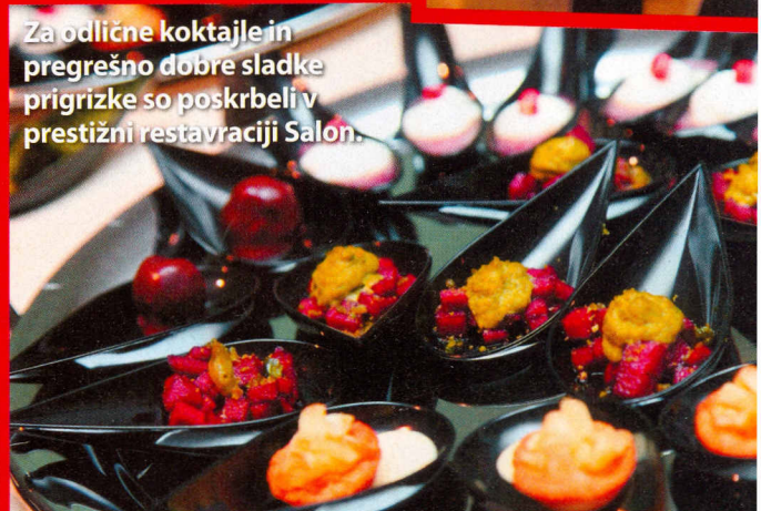
Za odlične koktajle in pregrešno dobre sladke prigrizke so poskrbeli v prestižni restavraciji Salon.